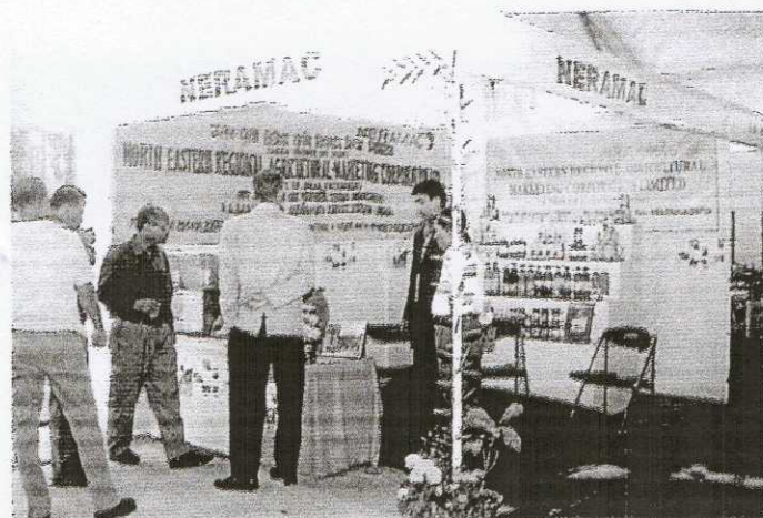
A view of NERAMAC Stall during NEARID Show at Bharalumukh, Guwahati during February 2004.