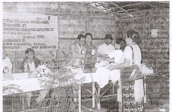
Inaugural Programme of the Fruit Preservation Training Programme at Dainadubi, Meghalaya during November 2003.