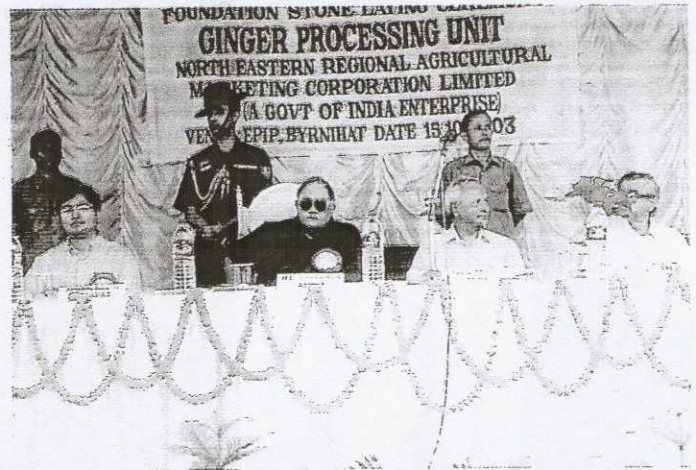
A view of the dignitaries during the Foundation Stone laying ceremony of Ginger Processing Unit of NERAMAC at EPIP, Byrnhit.