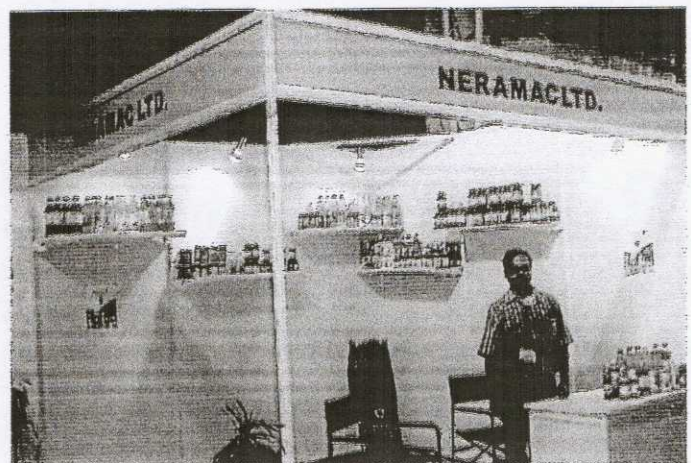
View of NERAMAC Stall at INDSUM FAIR 2004 held at Kolkata Maidan during Feb-March 2004 organised by FASII in association with NSIC.