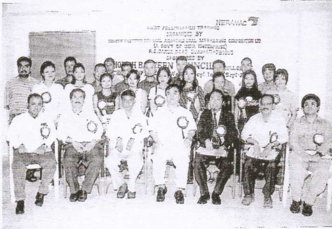
A group photograph of the participants at the Fruit Preservation Training Programme organized by NERAMAC with sponsorship of North Eastern Council, Shillong during September, 2003 at Chhingchhip, Mizoram.