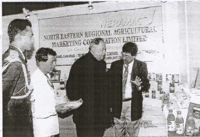
His Excellency Governor of Assam and Chairman, North Eastern Council visiting NERAMAC Stall at North East Business Summit during January 2004.