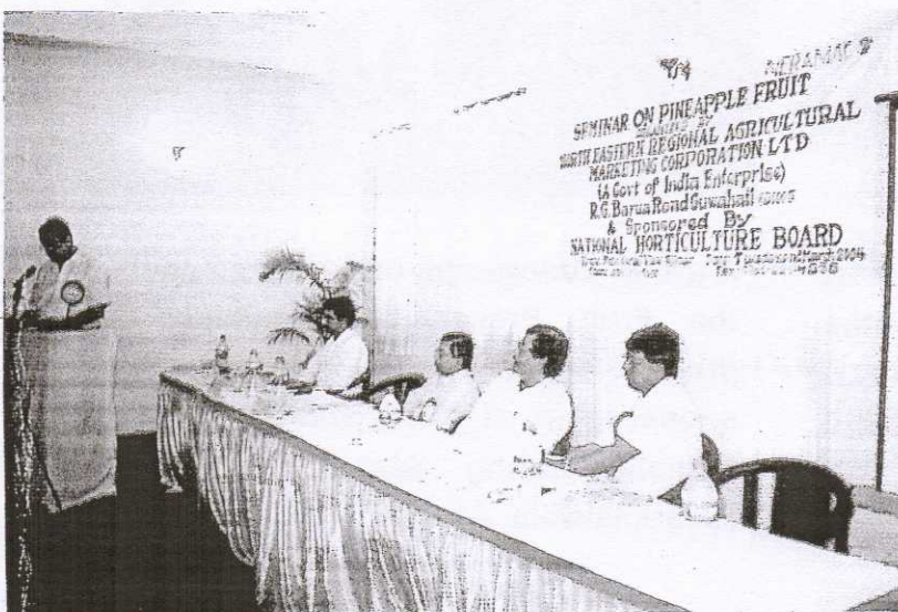
A view during the Seminar on "Pineapple Fruit" conducted by NERAMAC and sponsored by National Horticulture Board at Silchar on 21st March 2004.