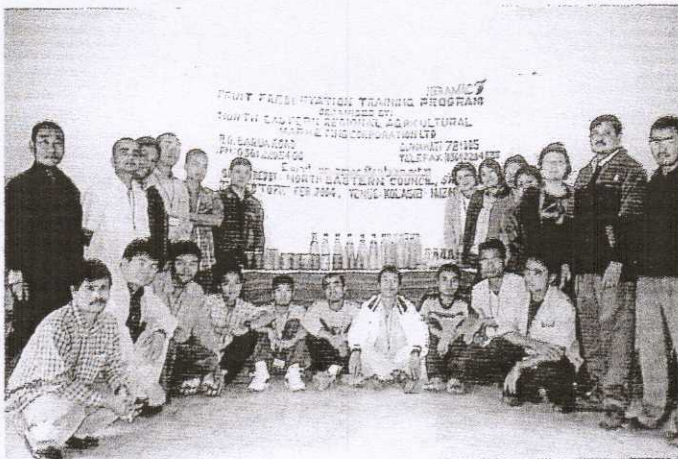
A view of the participants with products manufactured during the Fruit Preservation Training Programme held at Kolasib, Mizoram during 20th Feb 2004.