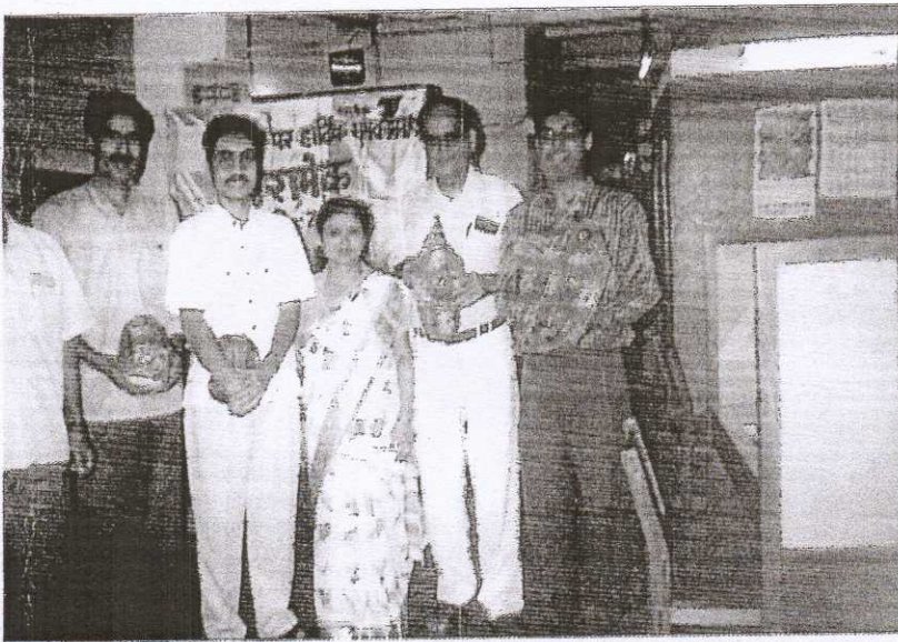
Award Winners of different competitions held during the celebration of Hindi Week 2003-2004 in NERAMAC

Lighting of lamp by Managing Director, NERAMAC in the inaugural programme of the seminar on "Bamboo Shoot Processing and Marketing" conducted by NERAMAC & CFTRI and sponsored by CBTC, UNIDO during 29th October 2003.