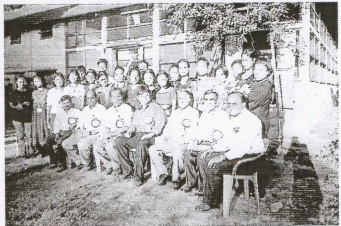
A group photograph of the participants at the Fruit Preservation Training Programme organized by NERAMAC with the sponsorship of North Eastern Council, Shillong during September, 2003 at Hmarkhawlein, Assam.